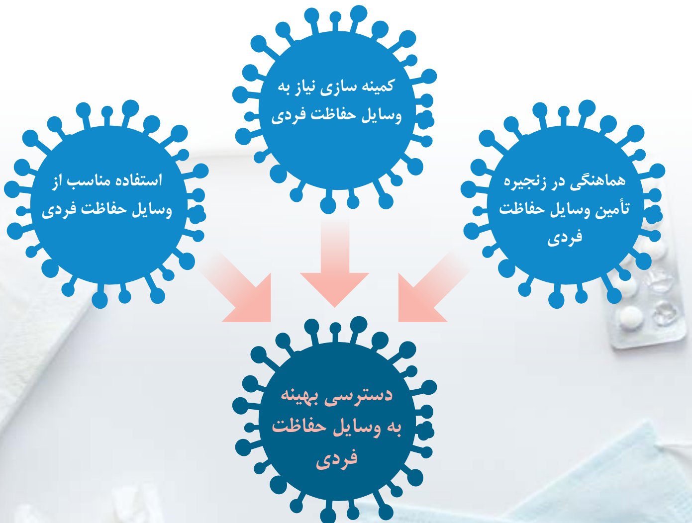
شکل ۱- استراتژی هایی برای بهینه سازی دسترسی به وسایل حفاظت فردی

با توجه به کمبود جهانی وسایل حفاظت فردی، استراتژی های زیر می تواند به بهینه سازی دسترسی به این وسایل کمک کنند (شکل ۱)